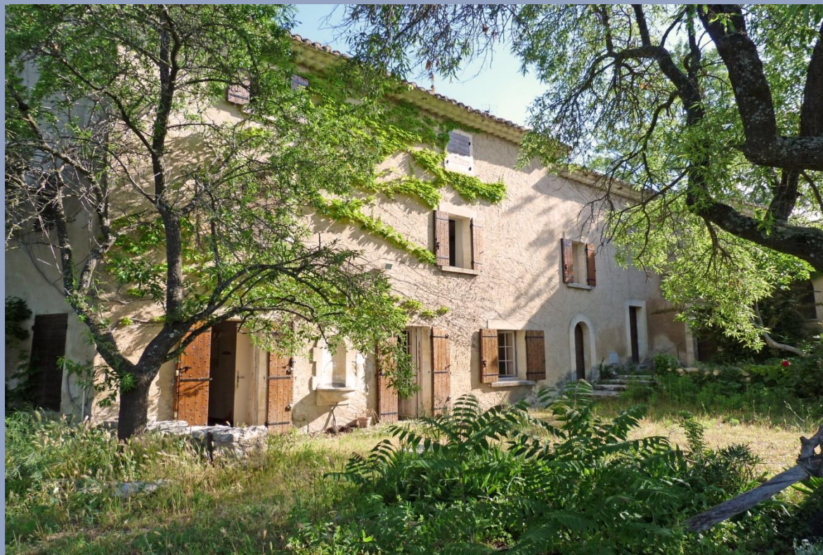
Surface utile : 200 m 2 - Chambres : 4 - Surf terrain : 997 m 2 - Vue Luberon

Dans la campagne de Gordes, ferme ancienne du 18 e siècle de 240 m 2 , 175 M 2 à rénover bénéficiant d'une fort potentiel sur un terrain avec restanques, en position dominante bordée de murets en pierres sèches de 1 200 m 2 environ.